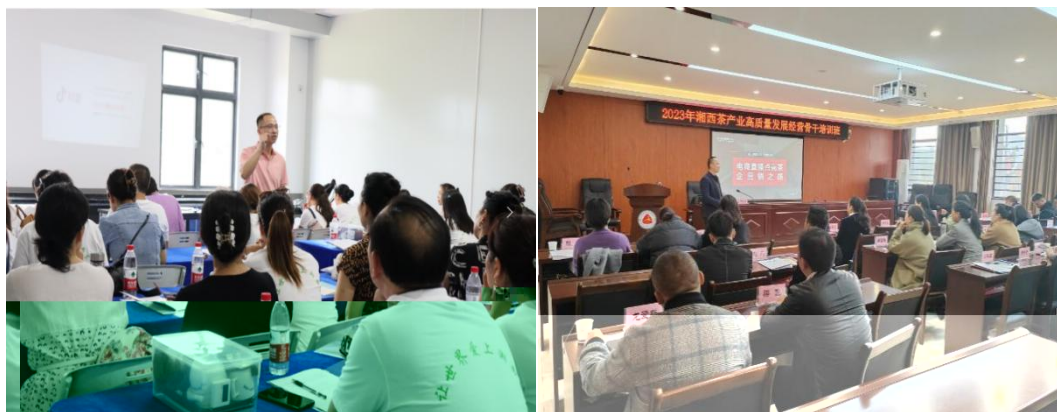
图 企业协助学校为湘西茶企开展电商直播培训

更 对 电 的 。 过 的 ， 茶 得 更 地 电 播的操 、 策 等方 的 ， 电 的 奠定 础。