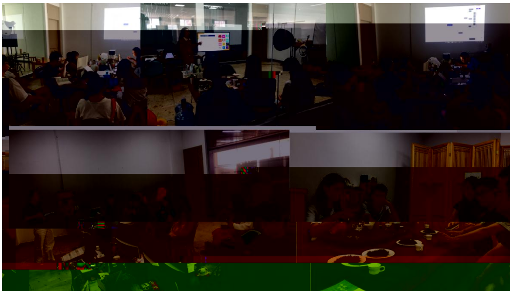
图 特邀企业专家来基地为学生进行专业培训

地 2023 地 ( 2), 供 宝贵的 。 过 的分 , 度 、 场变 , 对电 播 的 。 不 的 储备, 高 操 , 的 发 奠定 础。 措 合 的 度, 地 合 的 。