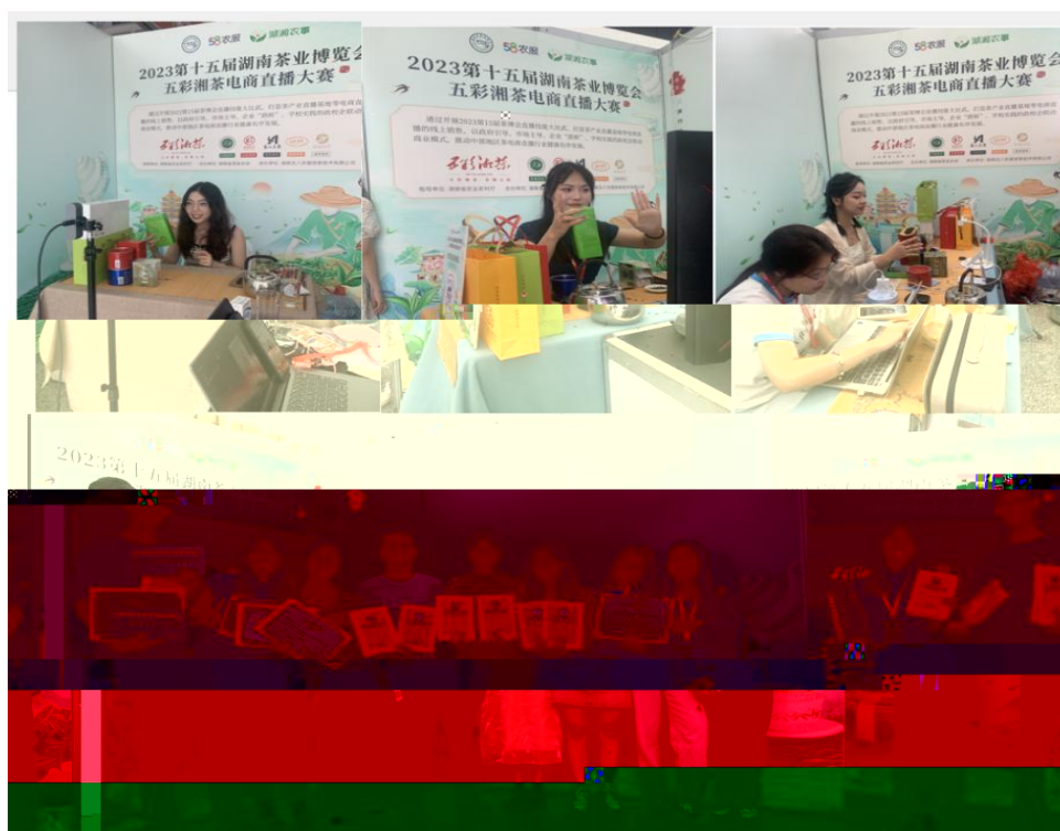
图 “湖南省第十五届茶博会” 电商直播比赛现场

播和方的，短 得的步。 队比 10多单、单， 包但不、等多个，的 和队得的高度。的 得不对公的，更对参 付出和的充分定。