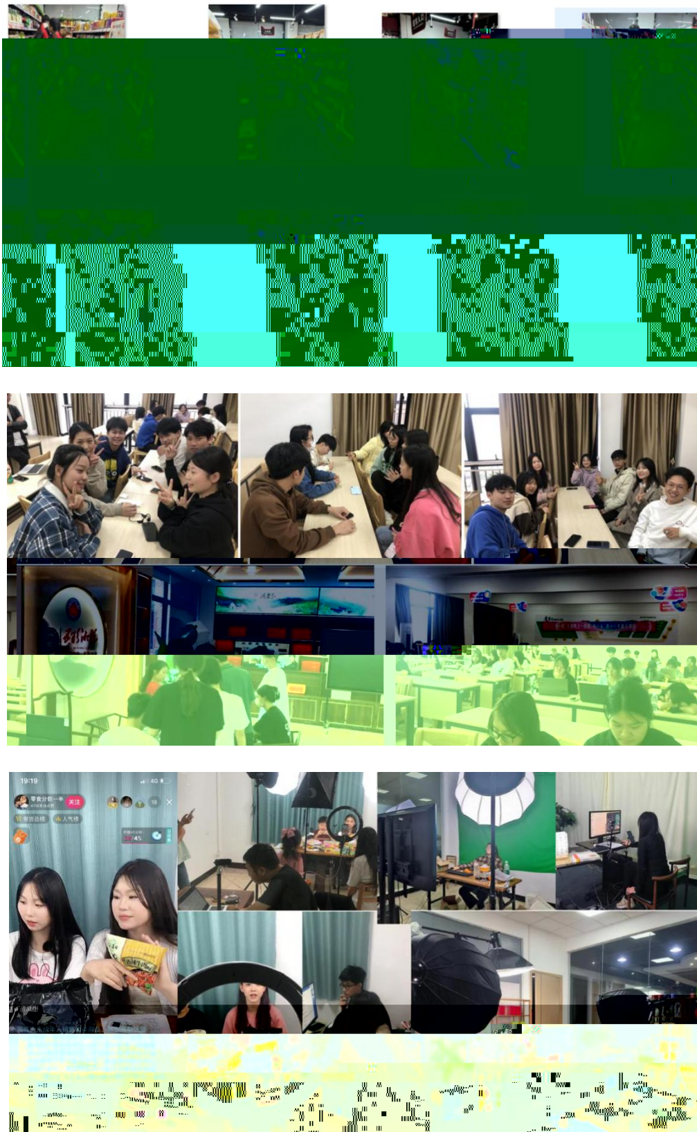
图 组织学生开展实习实训